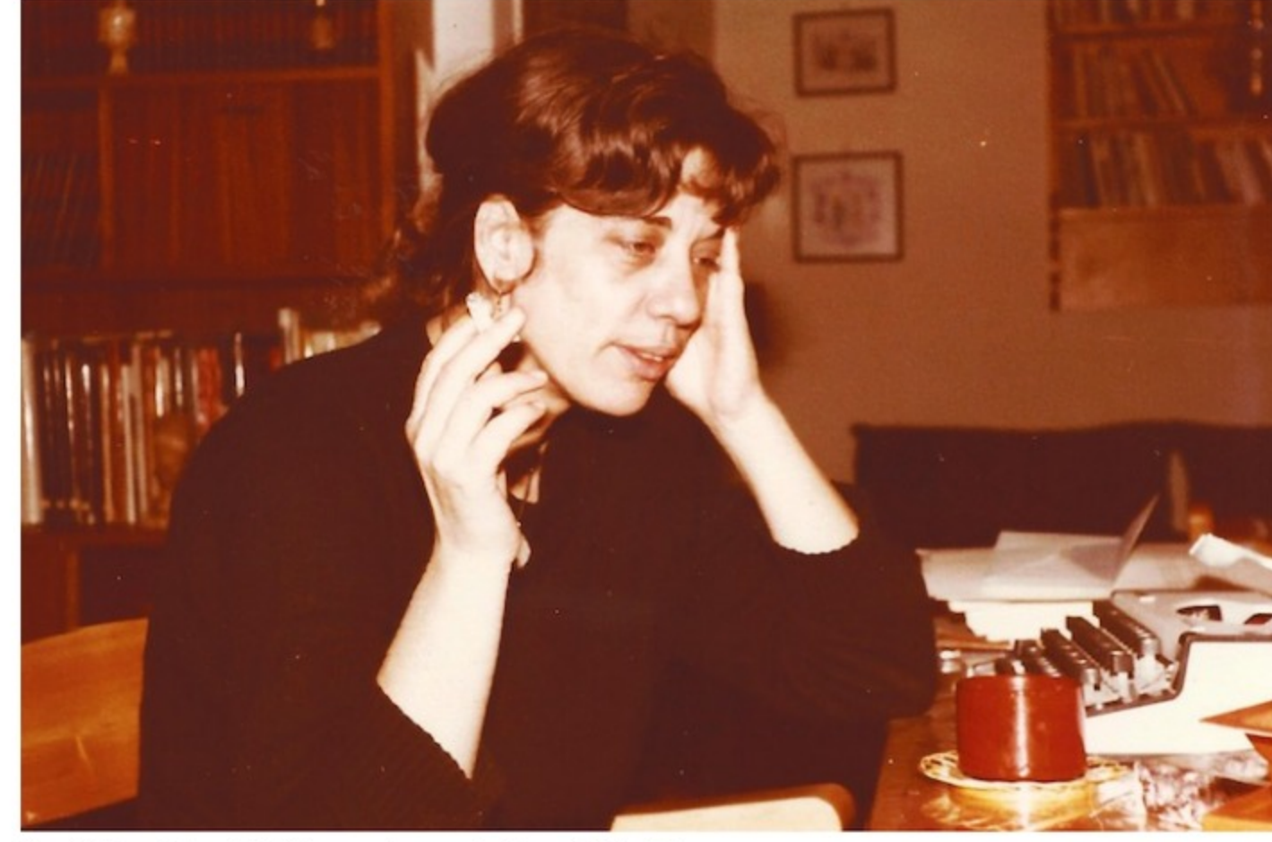
Για το βιβλίο της Ελένης Λαδιά «Η εσωγραφία μιας πεζογράφου» (εκδ. Αρμός).