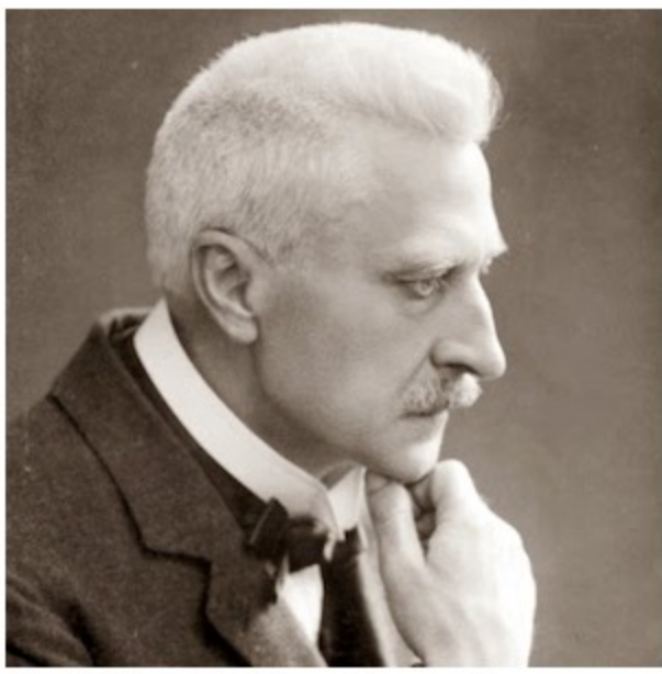
Ο Rudolf Otto (1869-1937) γεννήθηκε στο Peine της Κάτω Σαξονίας και σπούδασε στο Göttingen, Θεολογία και Φιλοσοφία. Από το 1917 έως το 1929 δίδαξε Συγκριτική Θρησκειολογία και Φιλοσοφία της Θρησκείας στο Πανεπιστήμιο της πόλης Marburg (Lahn), το οποίο είναι γνωστό ως κέντρο θρησκειολογικών και θρησκευτοφιλοσοφικών σπουδών.

Ωστόσο, αυτή η επιδίωξη των Διαφωτιστών να αναγάγουν το συνολικό περιεχόμενο της θρησκευτικής εμπειρίας στην ηθική εμπειρία προϋπέθετε την πληρότητα και την αυτοδυναμία της τελευταίας, με τελικό αποτέλεσμα να αναγνωριστεί βαθμιαία, με τη βοήθεια της αρχαιοελληνικής φιλοσοφίας, η αυτάρκεια της ηθικής. Η ηθικότητα θεωρήθηκε ως κάτι σταθερό και ανεξάρτητο από τη θρησκευτική αυθεντία, διατηρώντας τη βεβαιότητά της ακόμη και ανεξάρτητα από την ύπαρξη του Θεού.